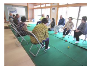
子育てサロン、いきいき健康サロンの様子